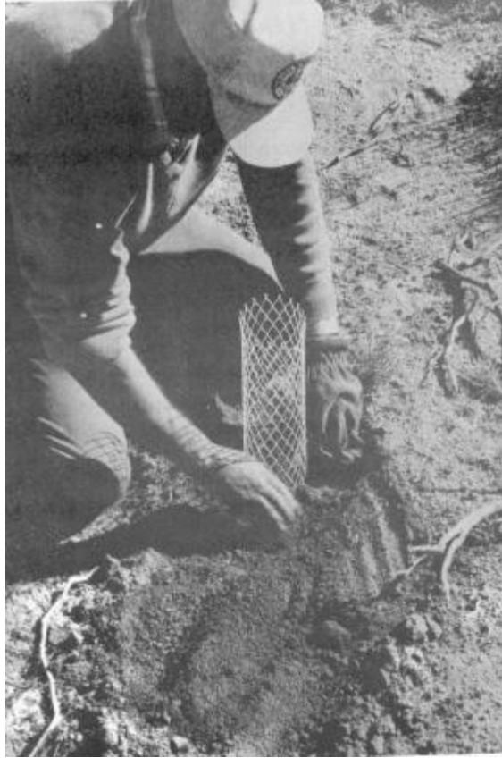
Foto 2.- Método de plantación manual y colocación de malla plástica.