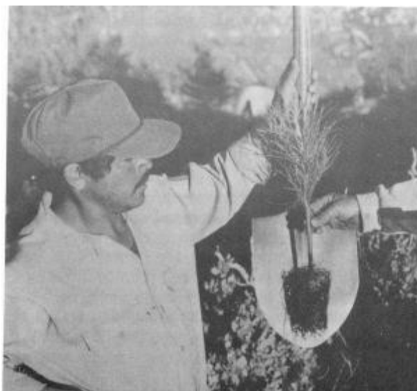
Foto 1.- Planta tipo a usar en reforestación.

En plantaciones realizadas en California se considera que se puede alcanzar hasta un 75 por ciento de sobrevivencia a los 5 años cuando se utilizan plantas de alta calidad y existe buena preparación del terreno.