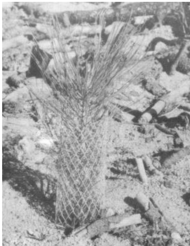
Foto 3.- Planta de pino protegida con malla plástica.

La malla es colocada en el momento del transplante, quedando de esta manera fija al suelo y protegiendo a la planta cuando esta es mas susceptible de ser dañada. Ver foto 3.